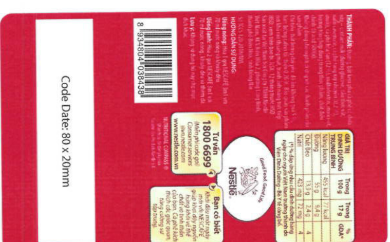
8,5cmx13,5cm left side