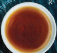
Tinh chất marshmallow kết hợp cùng tinh chất marshmallow giúp bạn cảm thấy dễ dàng uống sữa

Cà phê Phú Quốc Đánh thức hương vị Phú Quốc, đến cùng