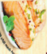
Hình ảnh minh họa chất minh hoa*